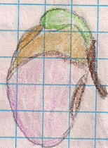
3) kwitowanie lodygi z liśćmi (pędki)